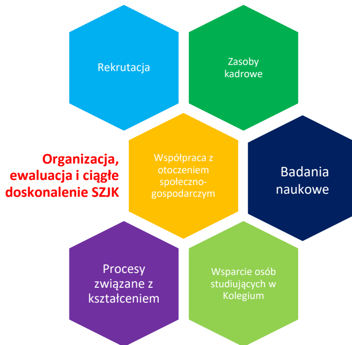
Rysunek 3. Mapa procesów